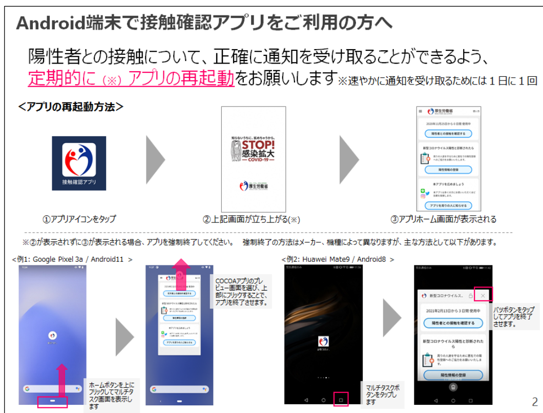
図 2 Android 版の再起動方法 (関連情報 3) から引用)

今回明らかになった接触通知機能に関する不具合は、2020 年 9 月 28 日の更新(バージョン 1.1.4)で新たに生じました。2021 年 2 月 18 日の更新(バージョン 1.2.2)で修正が図られたものの、正確な通知を受け取るためには 1 日に 1 回程度 COCOA を再起動する必要があると案内されています。ただし、次回以降の更新で再起動が不要になる可能性もあり、利用しやすくなることが期待されます。